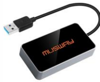
Musway BTA2 Bluetooth dongle