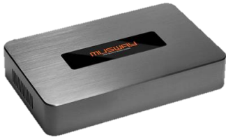
Musway M6v3 forsterker med DSP