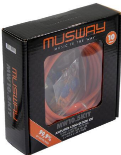
Musway MW105KIT strømkabelsett