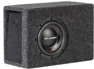
Gladen RSX 065 VB-CU subwoofer