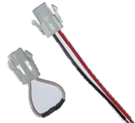
Strømlaske og tilkoblingsplugg subwoofer