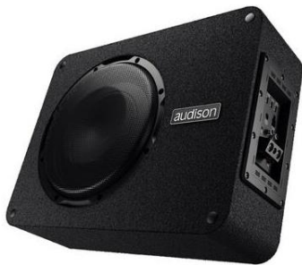
Audison APBX10AS2 Aktiv subwoofer