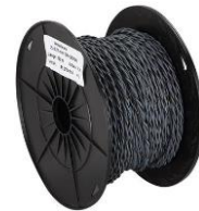
Installasjonskabel 2x0,75mm2 1 meter lengde